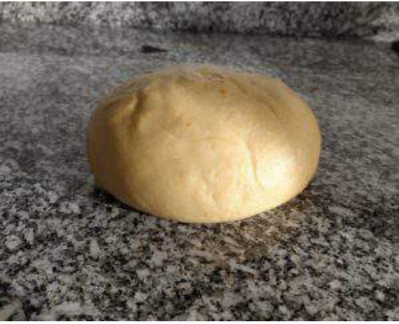
Masa de las orejas