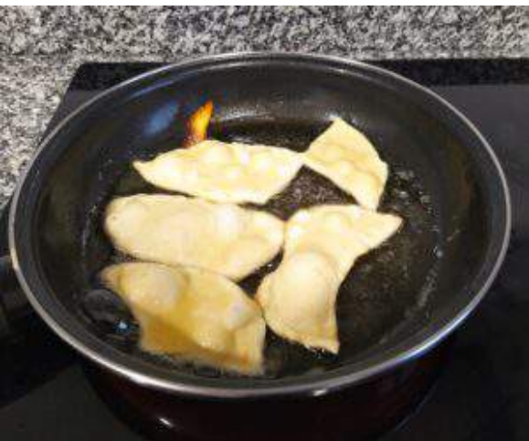
Fritura vuelta y vuelta